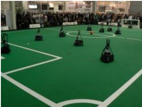
Das Endspiel in der Middle Size League (im Vordergrund die Roboter der Brainstormers Tribots) stieß auf großes Zuschauerinteresse.

Die größte Aufmerksamkeit fand aber das erneute Zusammentreffen dieser beiden Rivalen im Endspiel der Humanoid League. Schon oft haben die Dribblers und NimbRo gegeneinander gespielt. Immer sind die Partien zu Gunsten NimbRos ausgegangen. Immer konnte man den Eindruck haben, dass der Vorsprung nur hauchdünn war. Das war dieses Mal nicht anders. Zwar scheint das Ergebnis von 8:2 eine deutliche Überlegenheit von NimbRo auszudrücken. Doch hinsichtlich Tempo und Genauigkeit der Bewegungen lagen die Darmstädter nicht so weit hinter ihren Gegnern zurück. Durchaus denkbar, dass sie bei einer späteren Analyse des Spiels die entscheidenden Schwachpunkte ausmachen und diese bis zur Weltmeisterschaft Anfang Juli in Graz beheben können. Dann könnte es zu einer Neuauflage dieses Klassikers kommen.